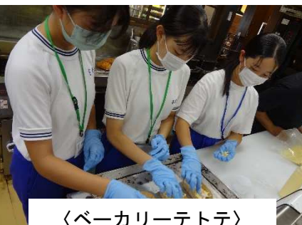
〈ベーカリーテトテ〉